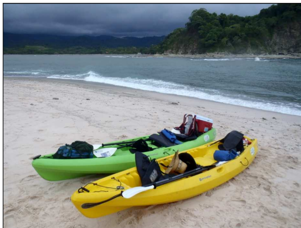
Kanu-Ausflug an der Pazifikküste vor Samara