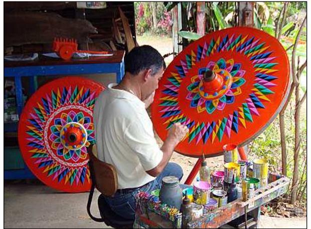
handbemalte Ochsenkarren in Sarchi