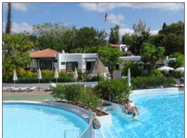
Bungalowanlage zum Relaxen im Süden La Gomeras