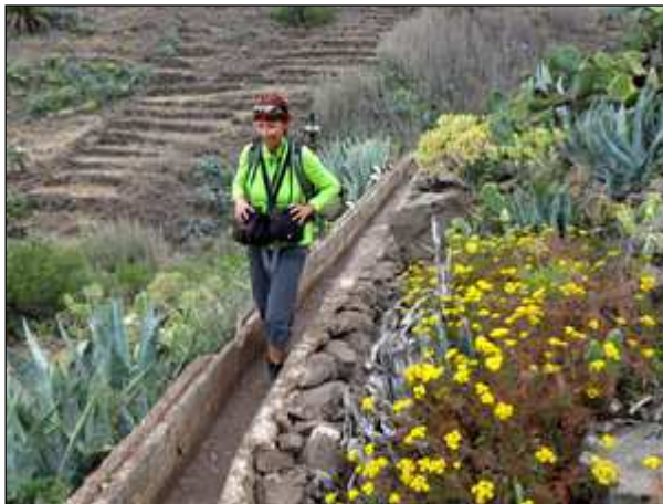
Wanderung ins Valle Gran Rey - La Gomera